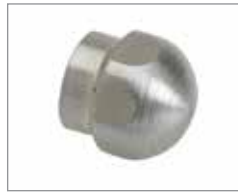
Закрытая насадка Soldier & 758