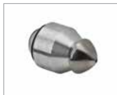
Насадка Warthog WV (50- 100 мм) 206 Бар @ 30 л/ мин - 9,5 мм