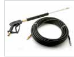
Комплект аксессуаров для промывки шланга