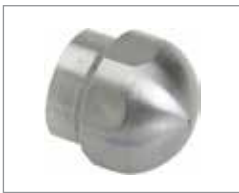
Открытая насадка Soldier & 758