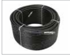
Термопластиковый шланг 9,5 мм x 76 м