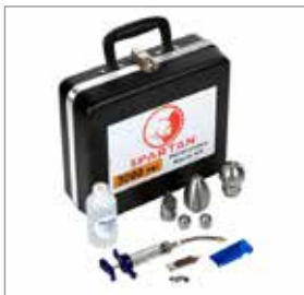
Набор насадок для работы при давлении 206 Бар