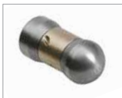
Вращающаяся насадка Soldier & 758