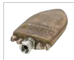
Лопатообразная насадка Soldier & 758