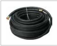
Садовый шланг 15,9 мм x 30 м