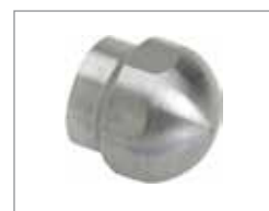
Открытая насадка Soldier & 758