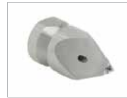
Q-образная насадка Soldier & 758