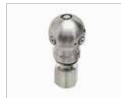
Насадка Warthog WT (75- 100 мм) 206 Бар @ 45 л/ мин - 9,5 мм СТР