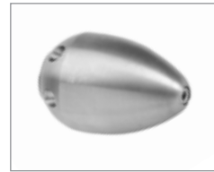
Ракетообразная насадка Soldier & 758