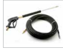
Комплект аксессуаров для промывки шланга