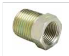
Переходник с 12,7 мм x 9,5 мм