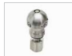
Насадка Warthog WS (100-200 мм) 206 Бар @ 45 л/мин - 9,5 мм СТР