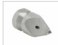
Q-образная насадка Soldier & 758