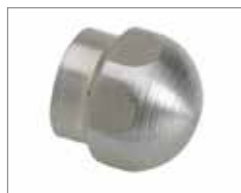
Закрытая насадка Soldier & 758