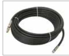
Термопластиковый шланг 6,4 мм x 22 м