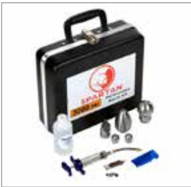
Набор насадок для работы при давлении 206 Бар