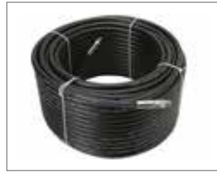
Термопластиковый шланг 9,5 мм x 76 м