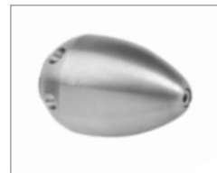
Ракетообразная насадка Soldier & 758