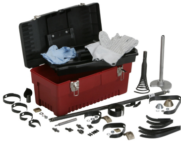
Ящик для инструментов