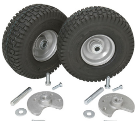
Дополнительный комплект пневматических колес