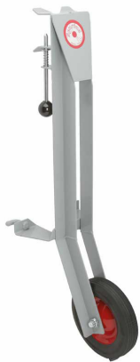
Подъемное устройство для погрузки машины в фургон или грузовик